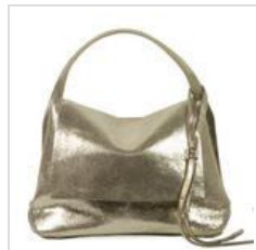
Borse brillanti firmate Gianni Chiarini