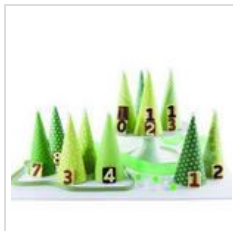
Pavoni Italia e le proposte per il Cake Design