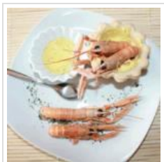
Ricetta scampi in black truffle sauce